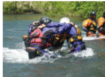
レスキュートレーニング実施状況

ラフティングガイドは技術の高い人材を国内、海外から呼び寄せ、ラフティング技術のトレーニング、レスキュートレーニング等様々なトレーニングを行い安全なラフティング体験を提供しております。 また、上級救命講習、急流救命救急の資格取得を積極的に推進し、ラフティングの安全対策を万全にしております。